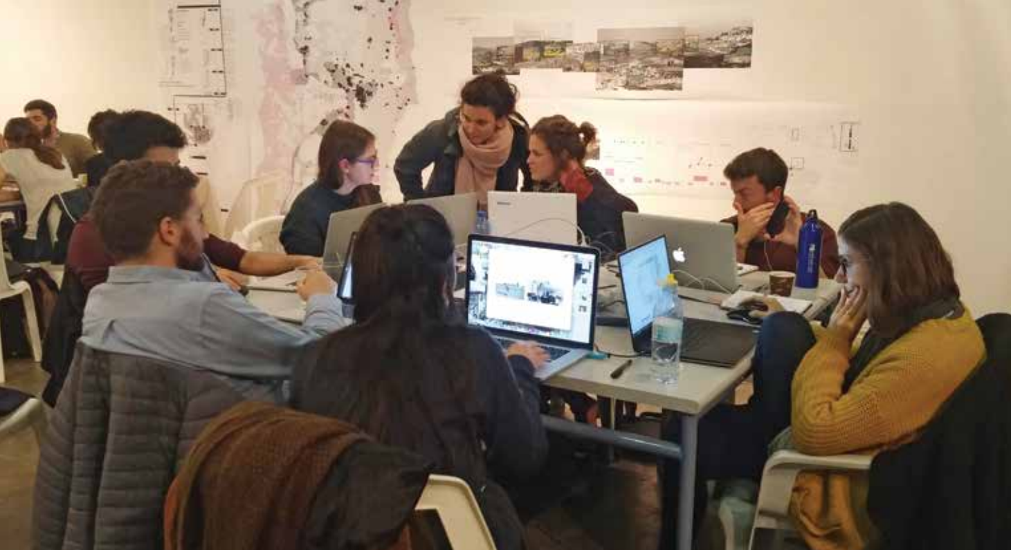
▲ שולחנות עבודה במסגרת סדנת חקלאות טריטוריאלית. שיתוף פעולה בין סטודיו LandBasics מהטכניון וסטודיו laba מה-EPFL שווייץ